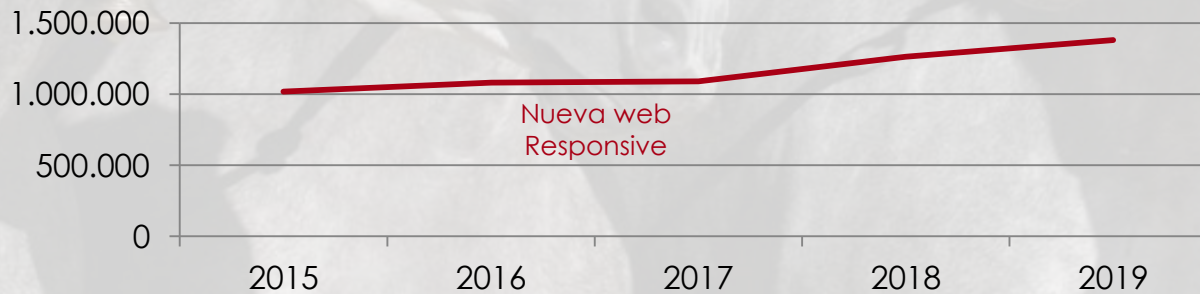
Visualizaciones de banners en www.ancce.com

Actualmente, los banners publicitarios cuentan con más 1.300.000 impresiones en el último año. Una opción publicitaria idónea para llegar de una forma muy directa y efectiva a los usuarios de la misma.